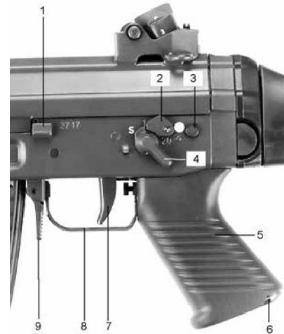
Die wichtigsten Teile auf Seite 6