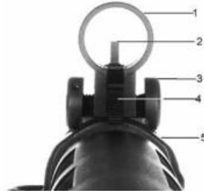
Abbildung 8: Kornaufsatz